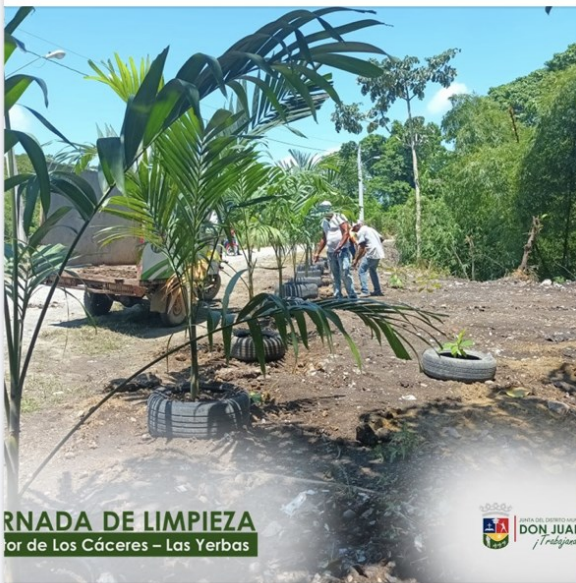
JORNADA DE LIMPIEZA en el Sector de Los Cáceres – Las Yervas

Nos llena de orgullo informar sobre el éxito de la segunda jornada de limpieza y concientización ambiental llevada a cabo por la Dirección de Gestión Integral de Desechos Sólidos y la Dirección de Medio Ambiente y Embellecimiento de la Junta del Distrito Municipal Don Juan Rodríguez. Esta importante actividad se realizó en el sector de Los Cáceres de la comunidad de Las Yervas.... Ver más